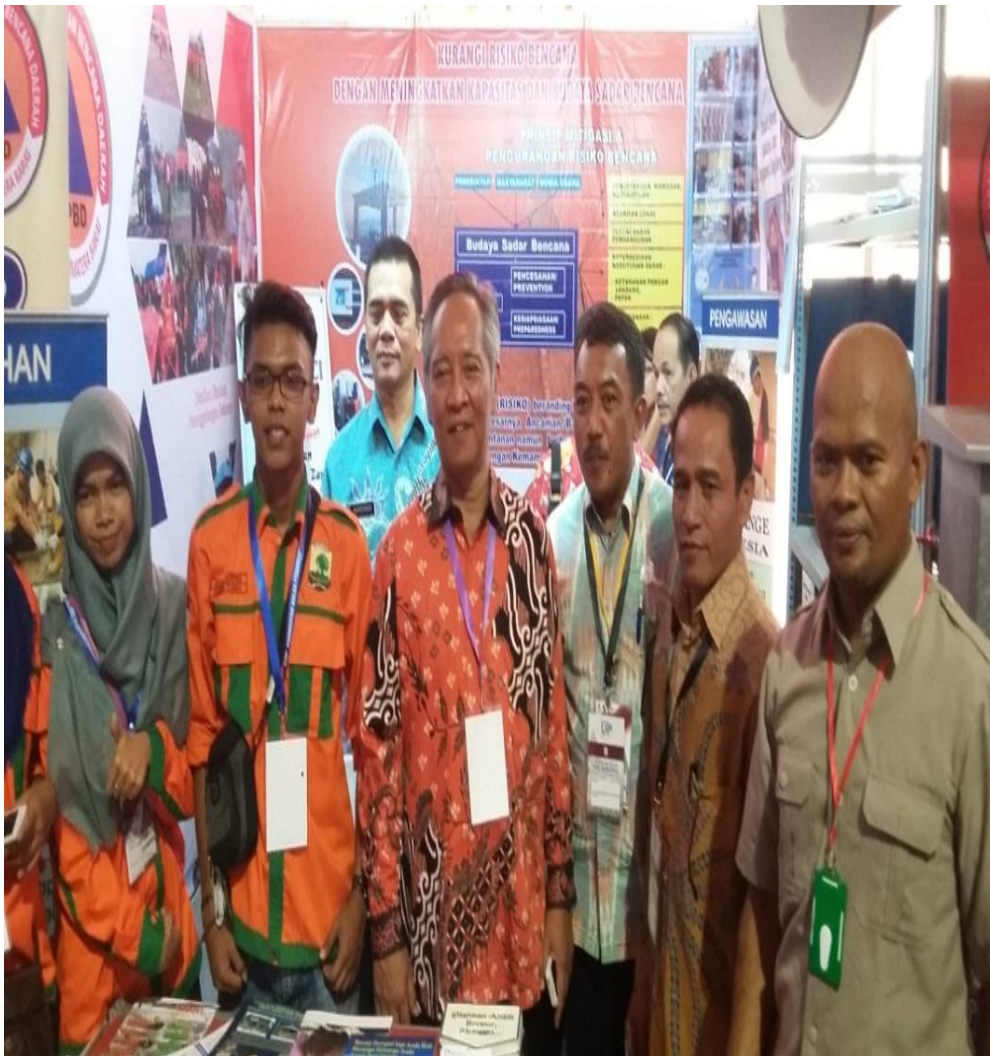
Kunjungan Deputi III BNPB ke Stand BPBD Prov. Sumbar