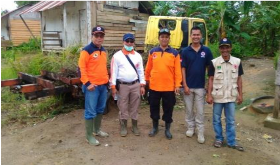
Gambar 3.13 Pelaksanaan Kegiatan Monitoring dan Evaluasi Kegiatan Rehabilitasi dan Rekonstruksi Pasca Bencana Gempa Bumi dan Tsunami Mentawai Tahun 2010