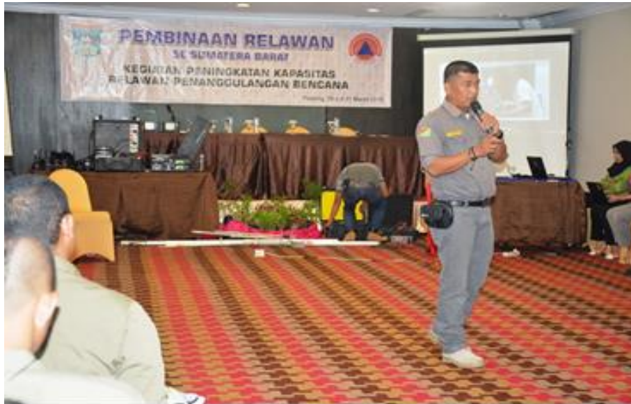
Gambar 3.3 Pelaksanaan Kegiatan Peningkatan Kapasitas Relawan Penanggulangan Bencana.

Kegiatan Pengembangan dan Peningkatan Operasional Pusdalops PB dilakukan dengan tujuan menyelenggarakan komunikasi, koordinasi, komando, kendali, secara efektif dan efisien melalui proses pengumpulan, pengolahan/analisis, verifikasi dan penyajian serta pendistribusian data/informasi secara cepat dan tepat dalam pelaksanaan kegiatan operasi penanggulangan bencana di Provinsi Sumatera Barat.