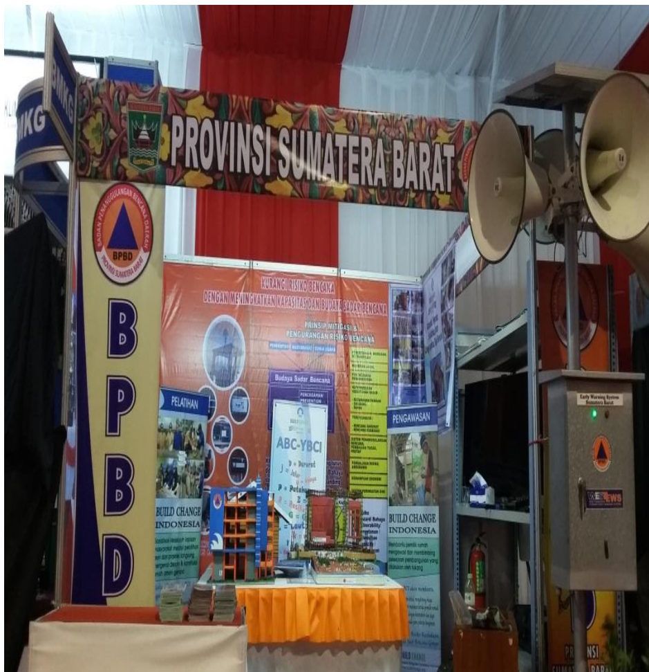
Stand BPBD Provinsi Sumatera Barat