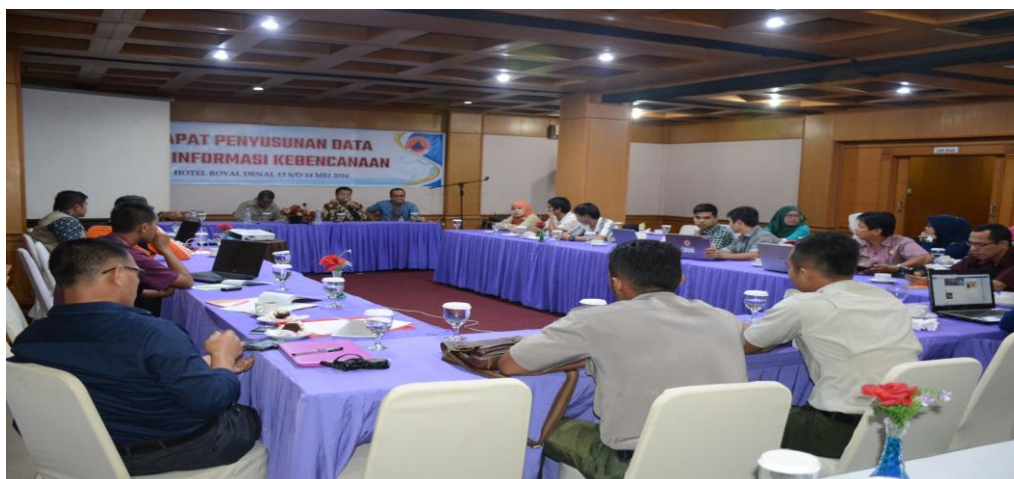
Gambar 3.1 Pelaksanaan Kegiatan Penyusunan Data dan Informasi Kebencanaan.

Kegiatan Peningkatan Informasi dan Sosialisasi Kebencanaan dilakukan dengan pembuatan brosur kebencanaan dan sosialisasi kebencanaan serta berfungsinya data, informasi kebencanaan dan terdesiminasinya kebencanaan kepada masyarakat. Kegiatan Peningkatan Informasi dan Sosialisasi Kebencanaan yang telah dilakukan selama tahun 2014, tahun 2015 dan tahun 2016 sebagai berikut: