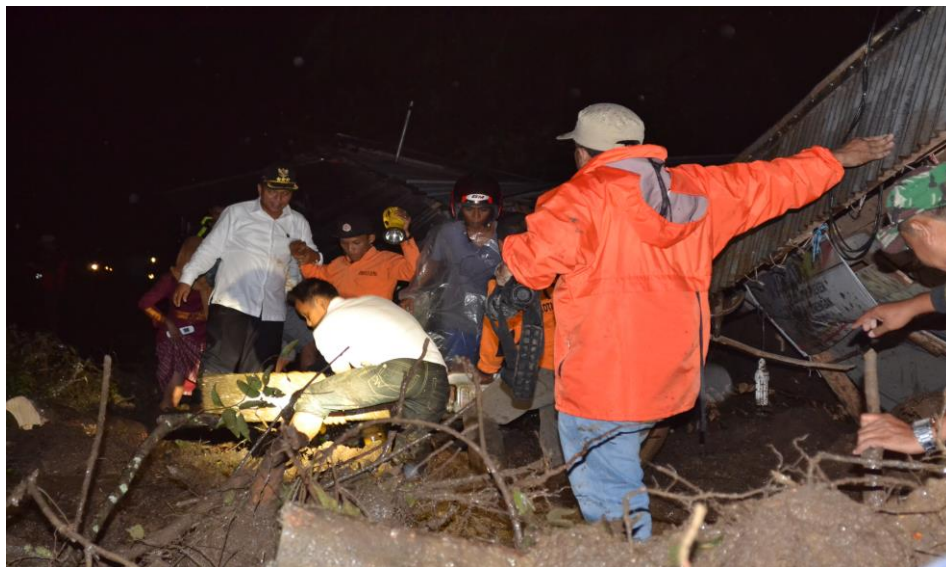
Gambar 3.8 Pelaksanaan Penanganan Tanggap Darurat Bencana.

Kegiatan Monitoring dan Evaluasi Pelaksanaan Penanganan Tanggap Darurat Bencana dilakukan dengan monitoring kejadian bencana dan mengevaluasi penanganan pelaksanaan tanggap darurat bencana yang terjadi selama tahun 2016 di Provinsi Sumatera Barat serta mengumpulkan data dan informasi kebencanaan terkait dengan lokasi kejadian, dampak dan jumlah korban, kerugian serta tindakan penanggulangan bencana yang dilakukan.