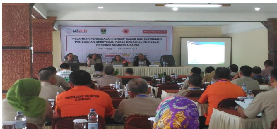
Gambar 3.11 Pelaksanaan Kegiatan Pengkajian Kebutuhan Pasca Bencana

Kegiatan Pengkajian Kebutuhan Pasca Bencana bertujuan untuk membekali para aparatur penyelenggara Rehabilitasi dan Rekonstruksi terutama Kepala Bidang Rehabilitasi dan Rekonstruksi, Kasi Rehabilitasi dan Kasi Rekonstruksi pada BPBD Kabupaten/Kota se Sumatera Barat termasuk pada BPBD Provinsi Sumatera Barat serta Instansi terkait Tingkat Provinsi Sumatera Barat, menyamakan persepsi sesama perangkat penyelenggara rehabilitasi dan rekonstruksi pada BPBD Kabupaten/Kota dan Provinsi serta Instansi terkait terutama dalam menetapkan kebutuhan pasca bencana di Sumatera Barat, meningkatkan peran serta dan kemampuan aparatur penyelenggara rehabilitasi dan rekonstruksi dalam proses pengusulan dana pasca bencana ke tingkat pusat (BNPB dan Kementerian/Lembaga).