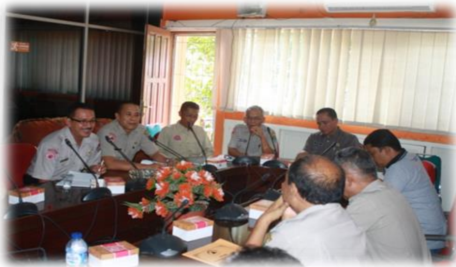
Gambar 3.10 Pelaksanaan Kegiatan Monitoring dan Evaluasi Pelaksanaan Rehabilitasi dan Rekonstruksi Daerah Pasca Bencana

Kegiatan Pengkajian Kebutuhan Pasca Bencana bertujuan untuk membekali para aparatur penyelenggara Rehabilitasi dan Rekonstruksi terutama Kepala Bidang Rehabilitasi dan Rekonstruksi, Kasi Rehabilitasi dan Kasi Rekonstruksi pada BPBD Kabupaten/Kota se Sumatera Barat termasuk pada BPBD Provinsi Sumatera Barat serta Instansi terkait Tingkat Provinsi Sumatera Barat, menyamakan persepsi sesama perangkat penyelenggara rehabilitasi dan rekonstruksi pada BPBD Kabupaten/Kota dan Provinsi serta Instansi terkait terutama dalam menetapkan kebutuhan pasca bencana di Sumatera Barat, meningkatkan peran serta dan kemampuan aparatur penyelenggara rehabilitasi dan rekonstruksi dalam proses pengusulan dana pasca bencana ke tingkat pusat (BNPB dan Kementerian/Lembaga).