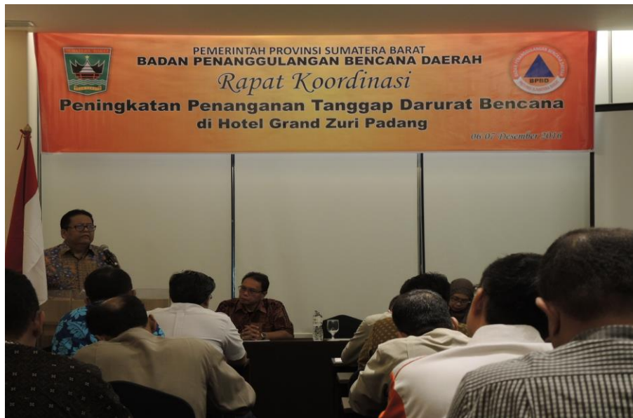
Gambar 3.7 Pelaksanaan Kegiatan Peningkatan Penanganan Tanggap Darurat.

Kegiatan Monitoring dan Evaluasi Pelaksanaan Penanganan Tanggap Darurat Bencana dilakukan dengan monitoring kejadian bencana dan mengevaluasi penanganan pelaksanaan tanggap darurat bencana yang terjadi selama tahun 2016 di Provinsi Sumatera Barat serta mengumpulkan data dan informasi kebencanaan terkait dengan lokasi kejadian, dampak dan jumlah korban, kerugian serta tindakan penanggulangan bencana yang dilakukan.