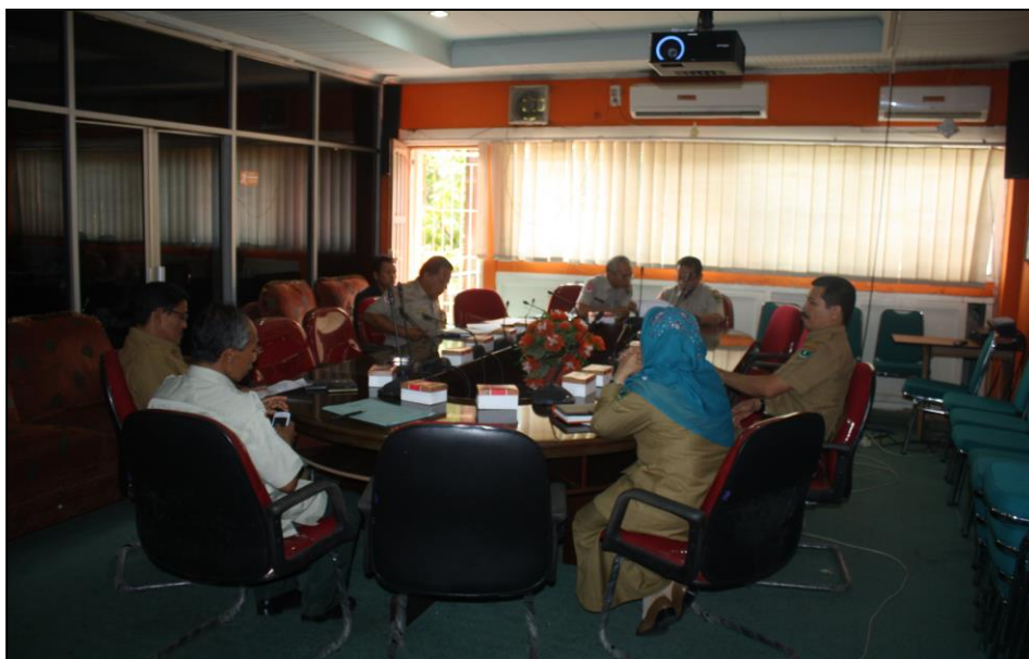
Gambar 3.12 Pelaksanaan Kegiatan Monitoring dan Evaluasi Kegiatan Rehabilitasi dan Rekonstruksi di Wilayah Provinsi Sumatera Barat

Kegiatan Monitoring dan Evaluasi Kegiatan Rehabilitasi dan Rekonstruksi di Wilayah Provinsi Sumatera Barat bertujuan untuk rangka pemantauan terhadap pelaksanaan kegiatan rehabilitasi dan rekonstruksi yang sedang dan telah dilaksanakan di tahun anggaran 2016, serta mencari solusi terhadap kendala-kendala dan permasalahan yang terjadi sehingga pelaksanaan pekerjaan dapat terlaksana dengan baik, kegiatan pada tahun 2015 ini dilakukan untuk memonitoring pelaksanaan Kegiatan Rehabilitasi dan Rekonstruksi yang dilaksanakan oleh BPBD Kabupaten/Kota baik fisik maupun penyerapan keuangan serta melakukan Rapat Monitoring dan Evaluasi Kegiatan Rehabilitasi dan Rekonstruksi Pascabencana.