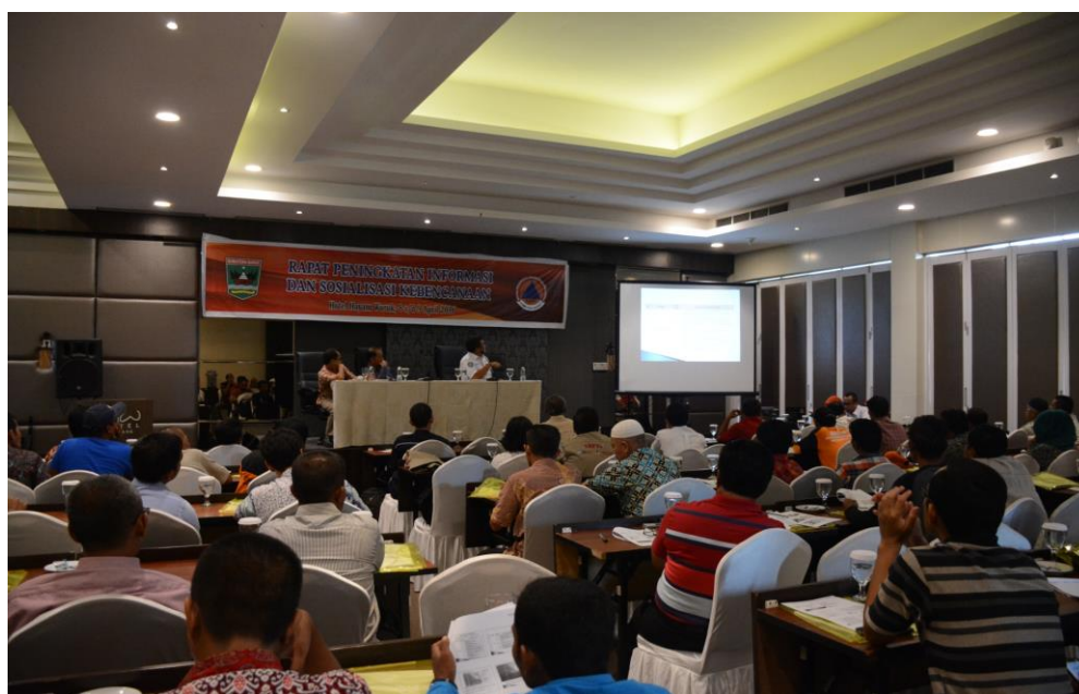
Gambar 3.2 Pelaksanaan Kegiatan Peningkatan Informasi dan Sosialisasi Kebencanaan.

Peningkatan kapasitas kelembagaan penanggulangan bencana daerah bertujuan untuk memilih dan menetapkan Unsur Pengarah Penanggulangan Bencana Sumatera Barat periode 2014-2019. Peningkatan kapasitas kelembagaan penanggulangan bencana daerah yang telah dilakukan selama tahun 2014, tahun 2015 dan tahun 2016 sebagai berikut