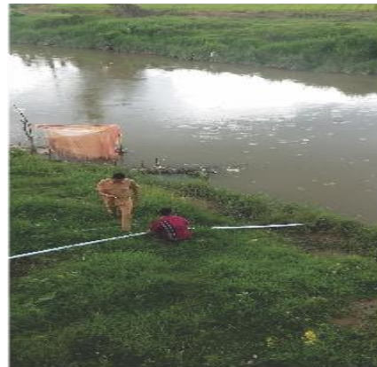
Gambar 3.5 Pelaksanaan Kegiatan Peningkatan Sarana dan Prasarana Kesiapsiagaan Bencana.

Peningkatan Sarana dan Prasarana Penanganan Tanggap Darurat dilakukan dengan perawatan kendaraan dapur umum, peralatan peringatan dini kedaruratan dan uji fungsi peralatan kedaruratan.