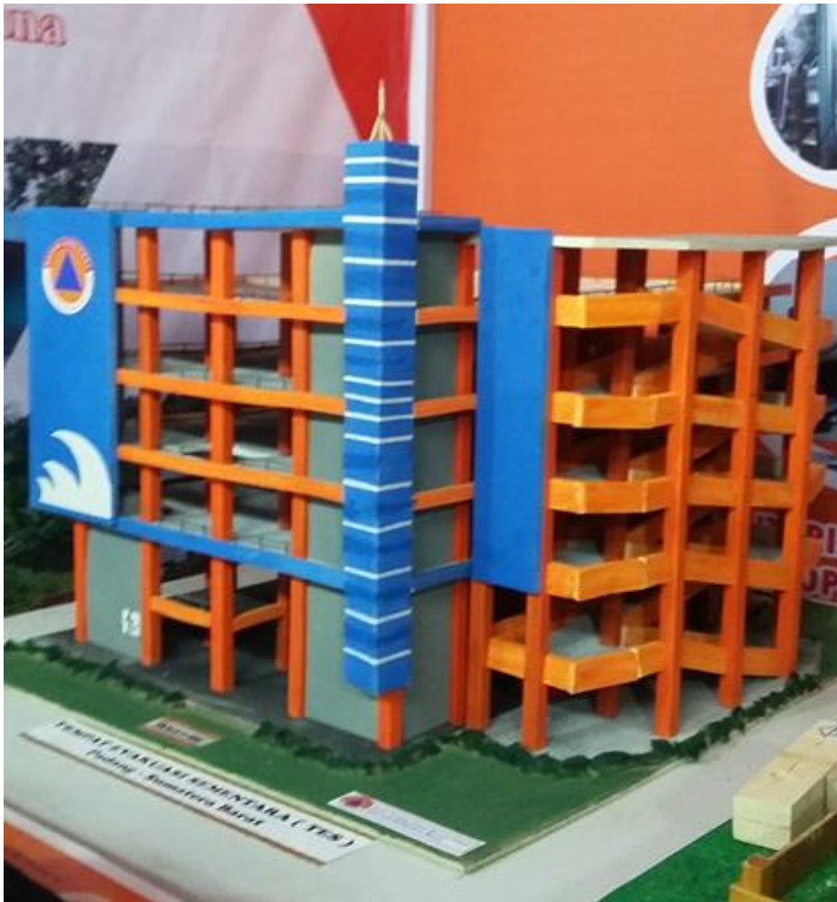
Miniaturn TES yang di pameran di Stand BPBD Provinsi Sumatera Barat