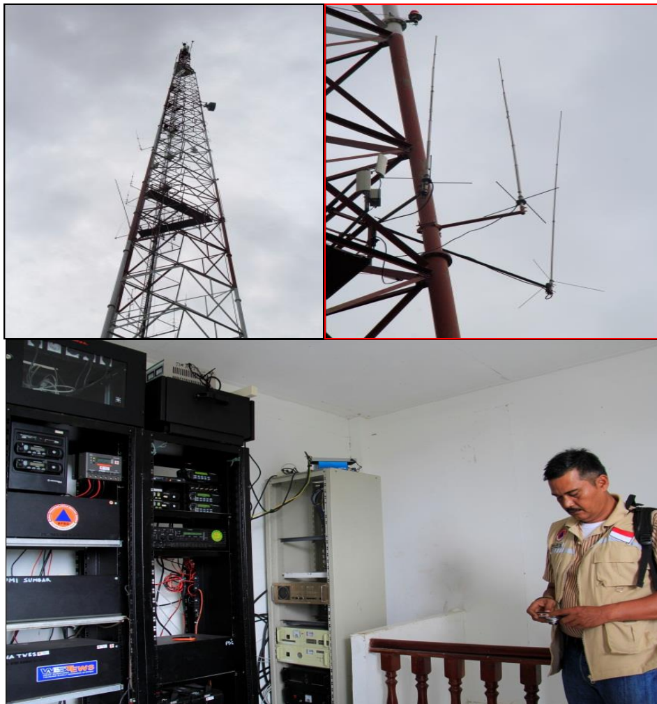
Gambar 3.6 Pelaksanaan Kegiatan Peningkatan Sarana dan Prasarana Penanganan Tanggap Darurat.