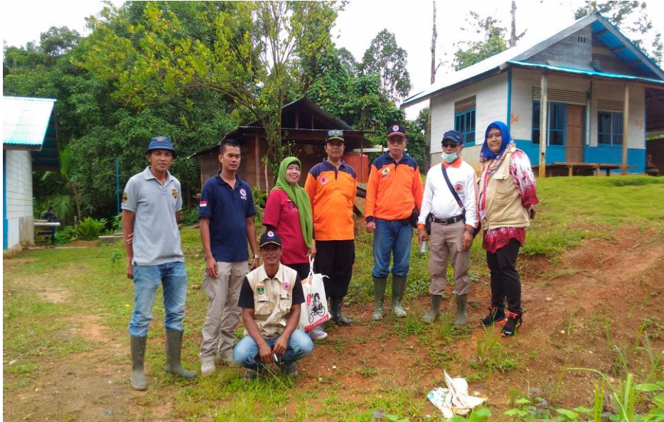
Gambar 3.9 Pelaksanaan Kegiatan Peningkatan Rehabilitasi dan Rekonstruksi Daerah Pasca Bencana

Tujuan lain untuk mencari solusi terbaik dalam pelaksanaan kegiatan rehabilitasi dan rekonstruksi pasca bencana apabila di temukan nantinya kendala-kendala dalam pelaksanaannya, sehingga kegiatan tersebut dapat berjalan dengan lancar dan tepat sasaran, dan memulihkan kembali serta meningkatkan perekonomian dan penghidupan masyarakat tersebut setelah pelaksanaan kegiatan rehabilitasi dan rekonstruksi ini selesai.